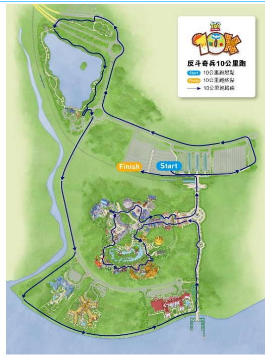
「反斗奇兵 10 公里跑」